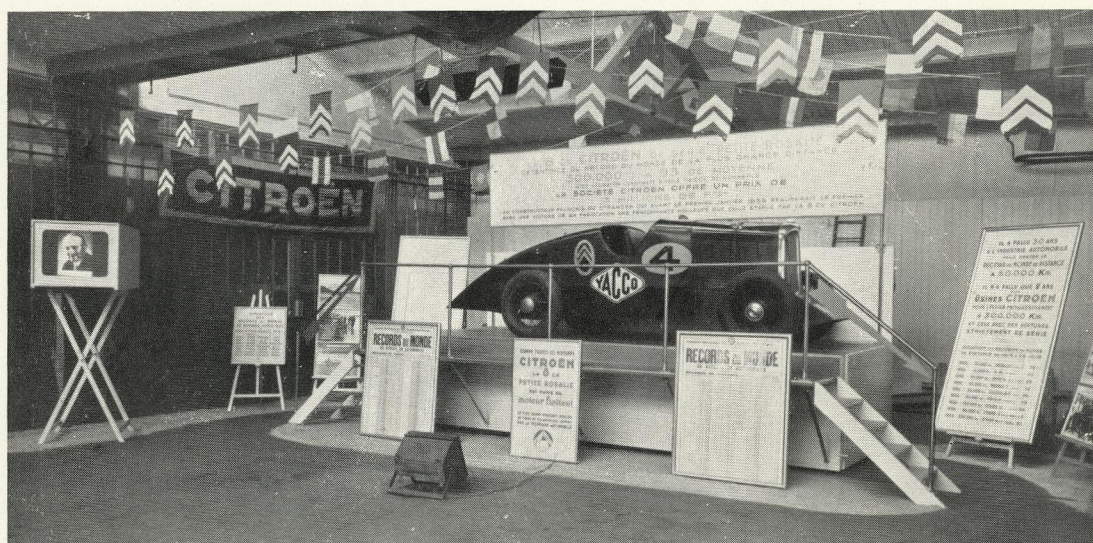
DISPOSITION TYPE DU STAND D'EXPOSITION DE "PETITE ROSALIE"

se jouaient des records. Il a mis fin à mon bonheur de vivre et d'étonner le monde. Oui, Monsieur, c'est lui qui m'a livrée aux mains des bourreaux, de cette "commission d'experts de quinze membres" qui, en quelques heures, ont cassé tous les miens... pour les observer au microscope !